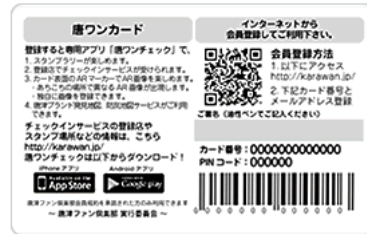
図2: 唐ワンカード裏面バーコード