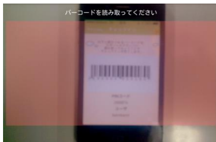
図3: バーコード読み込み画面イメージ