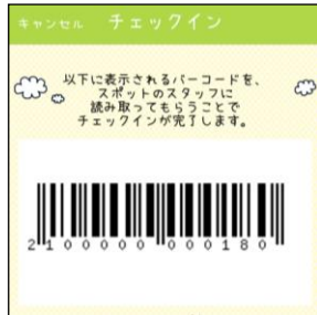
図1: 唐ワンチェックアプリ内バーコード

ご来店のお客様の「唐ワンチェックアプリ」(図1)もしくは「唐ワンカード」(図2)に表示されたバーコードを読み込んでチェックインを行います。